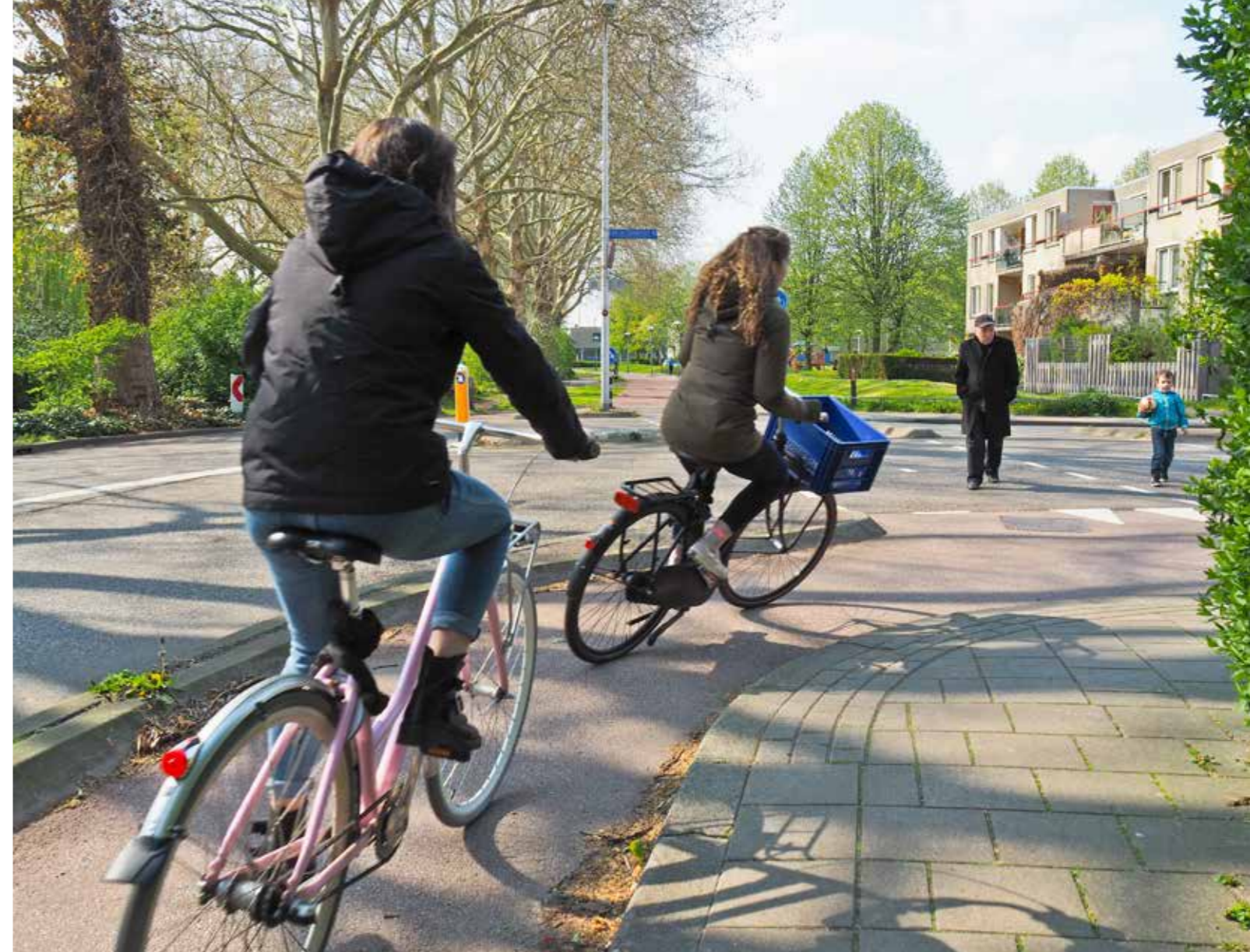
Gevaarlijke situatie voor fietsers op de bocht Alexander Numankade / Jan van Galenstraat